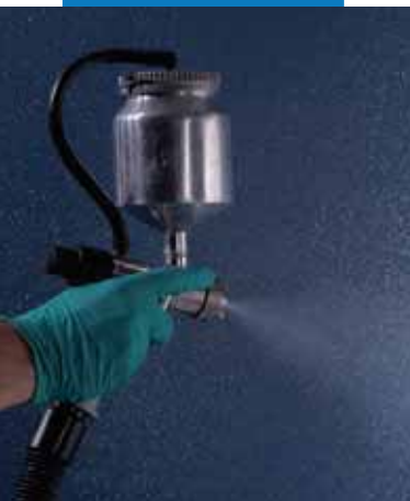
Финишная обработка с помощью Silancolor Topachino с MapeLux Lucida и MapeGlitter, цвет Silver